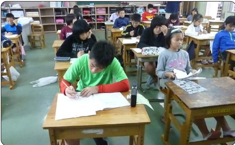
集中・脳にいっぱい汗をかきました。

四月十八日(火)全国一斉の全国学力学習状況調査が六年生を対象に実施されました。春休みから五年生対象に補習補講を行い、新学期になっても補習計画を立て学習に取り組んできました。根気強く学習に取り組む態度が見られ、「やり通す」という気持ちがとても強くなったと感じます。当日は、午前中に「国語A 算数A」「国語B」「算数B」「質問紙」と盛りだくさんで集中力を継続しなければならず、大変でしたが子ども達は大変よく頑張りました。褒めて下さい。