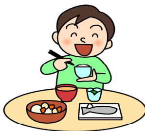
[しっかりした食事]