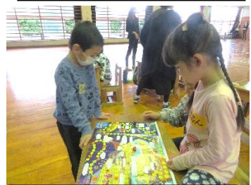
すごろくを楽しんでいます。