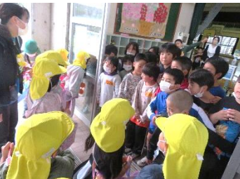
最後は手作りのプレゼントをもらって、元気に帰って行きました。「バイバイ。またくるねえ〜」