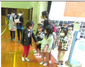
ドキドキの新入生の手を引いて案内します。