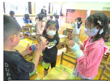
カスターネットでリズム遊び。

最初は緊張していた新入生も、やさしい一年生のおかげで笑顔に変わり、元氣よく一緒に遊んでいました。