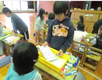
お勉強道具の説明をしています。使い方も教えています。

最初は緊張していた新入生も、やさしい一年生のおかげで笑顔に変わり、元氣よく一緒に遊んでいました。