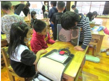
読み聞かせをしてあげています。とっても一生懸命です。

二月十五日、来年入学する一年生の体験入学が行われました。そわそわしていた新入生を一年生が一つ一つ丁寧に教えていました。