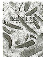
おとしたのはだれ?