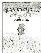
そらをとびたかったペンギン